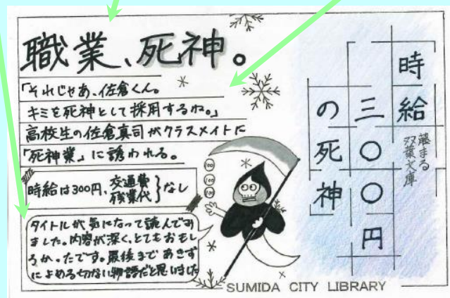
令和3年度 図書館員賞(よみもの部門)