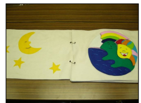
(今年度寄贈していただいた布の絵本です。)