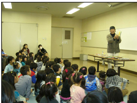
（絵本ライブの読み聞かせの様子）

絵本ライブでは、参加した子どもはもちろん、大人の方も笑ってしまうほど面白おかしく自作の絵本を読み聞かせてくれました。