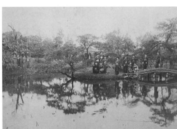
【岐雲園と伝わる写真】