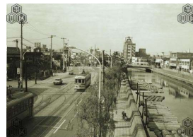
【1965年頃の北十間川十間橋と柳橋】

これらの資料のご利用については、「画像データの利用について」をお読みの上、所蔵先にお問合せください。