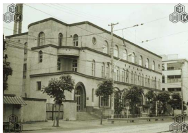
【1965年頃の墨田区役所 旧第一庁舎】

地域別、年代別及びマップから資料を検索できますので、ぜひ一度ご覧になってください。