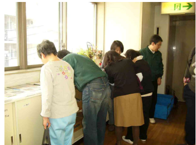
すみだふれあいセンター福祉作業所で本の貸し出しをしている様子です。