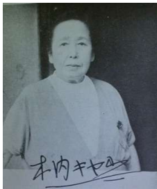
『教育一路』木内キヤウ著より

『知られざる渥美清』大下英治著 教木内キヤウ著 『拝啓渥美清様』読売新聞社会部編