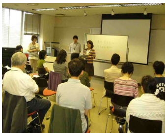
新図書館プロジェクトリーダー講座の様子です。