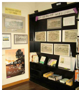
墨田区立あずま図書館 郷土コーナー

平成24年6月から墨田区立あずま図書館郷土コーナーでは、「江戸一目図屏風」のパネル展示を行っています。