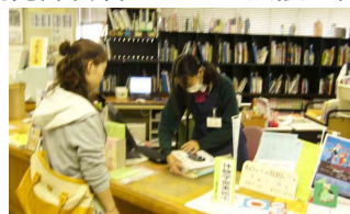
カウンター業務を体験している様子です。