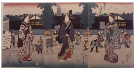
「本所の景勝」幕末の津軽候屋敷前の正月風景