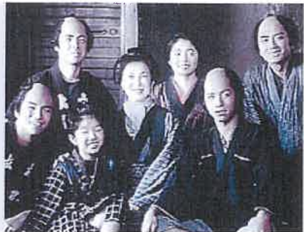
おかつ一家に勇吉が家族に…

[市川崑監督が語る作品について]…行き詰まった時代のなかで、とびぬけた義侠心でなくごく平凡な人間性を描き出せればと思った。今忘れがちな人格というものを下敷きにして、落語調の面白さをちょっぴりいただきながら、乾いた現代に潤滑油とでも言いますが「かあちゃん」という人間の健気さと小気味よさと苦心サンタン振りを中心にしたあたたかい物語です。 (上映時間 100 分)