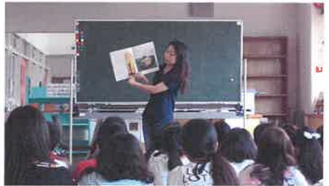
小学校でのブックトーク活動

主に子どもたちへ紹介する活動のことです。本の魅力を伝えることで、子どもの読みたい気持ちを育み、読書の世界を広げます。