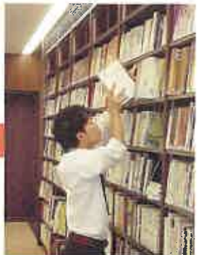
本の並び方が乱れている書架は、出し入れが頻繁な人気のコーナーなのかも