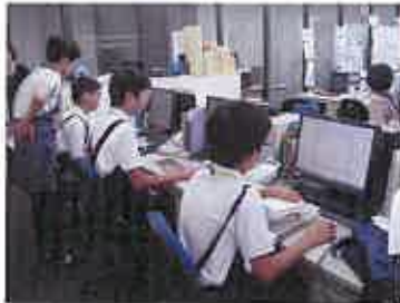
図書館専用パソコンを使って、納品された本の受け入れ作業を体験

7月に、本所高校と吾嬬第二中学校の生徒が、ひきふね図書館で職場体験をしました。 今号では、職場体験の様子とともに、図書館の舞台裏などをご紹介します。 暑い夏は、涼しい図書館で、実習生のオススメ本を楽しみませんか？