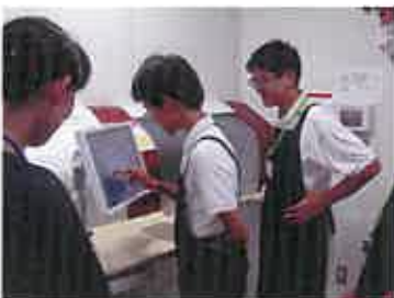
タッチパネル式パソコンを操作し、自動出納書庫から本を呼び出す

書庫（閉架）に保管されている資料の取出しを自動化することで、利用者の待ち時間を短縮する「自動出納書庫」への、本の入庫を体験しました。自動出納書庫入り口のタッチパネル式のパソコンを操作すると、本を収納するコンテナが出てきて、本を入れると自動で本を認識し、元の位置にコンテナを格納します。