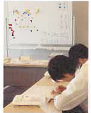
障害者サービスの体験では、点字で学校名・学年・名前を打ちました

図書館の本は、原則、本の内容等に沿って付された分類記号順に並んでいます。返却された本を分類記号順に並べる、書架（本棚）が乱れているときは分類記号順に並べ直すといった作業を行いました。