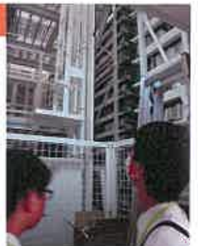
23区内初の自動出納書庫の稼働風景に釘付け