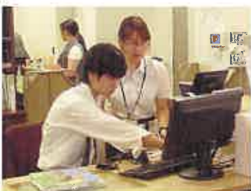
返却された本に傷や汚れがないかよく確認したあと、返却処理

本の耐久性を高めるため、本に透明なフィルムを掛けます。本の大きさに合わせてフィルムを選び、本とフィルムの間に空気が入らないよう、慎重に作業を行いました。