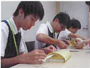
綺麗な状態で本を手にとっていただけよう丁寧にフィルム掛け

本の状態を確認後、墨田区立図書館の本である証として蔵書印などを押印します。続いて、図書館専用パソコンを使い、資料IDや所蔵館、利用対象、分類記号、請求記号、書架などを指定します。最後に、ICタグの読み込みの処理を行い、書架（本棚）に並べます。