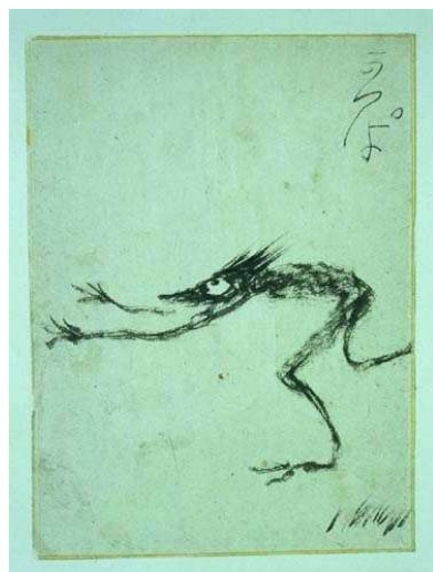
芥川龍之介自筆の河童

妻の文は夫龍之介の死顔をみて「お父さん、よかったですね。」と言ったというから(『追想芥川龍之介』資料コード11060324)よほど辛いトラブルを抱えて生きていたのだ。龍之介の死の5か月