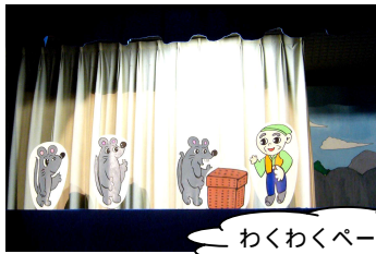
わくわくペープサート

今月は各館、下記の日程で人形劇・夏の子ども会を開催致します。人形劇の他にブックトーク(本の紹介)や読み聞かせ等も行います。たくさんのお本・物語に出会いに、この夏は図書館の人形劇(子ども会)へいらっしやいませんか?