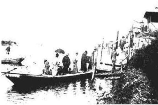
明治のころの竹屋の渡し(「墨東外史すみだ」より)

この本の魅力は、なんと言っても前付ページの写真と絵画である。明治の頃、隅田川に矢切の渡しのような渡し舟があったのをご存じだろうか。「竹屋の渡し」といい、写真で見る限り十人ほどでいっぱいになりそうな小舟だが、これで向島の三囲神社の鳥居下から浅草の山谷堀入口待乳山下まで横断したという。どのくらいの距離を歩き来たのだろうか。本文には竹屋の渡しに関する距離の記載はないが、現在の白鬚橋近くで運行していた橋場の渡しについては、「浅草川ニ在り。本町(浅草区橋場町)ヨリ寺島村ニ渡ル。廣サ二町深サ二丈。不内備考ニ古ヘ隅田渡ノ址ナリト云フ。」とある。二町は約220mであり、水の流れに棹差してこの距離を漕ぐのは、かなり大変だったことだろう。