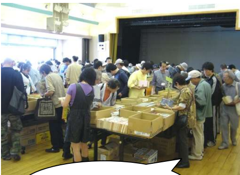
たくさんの方にご来場いただき、大盛況でした。