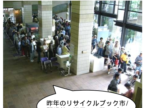
昨年のリサイクルブック市/開場前の様子(1階ロビー)

最近のベストセラーや、きれいで新しい本の寄贈を歓迎しています。寄贈していただける場合は、お手数ですが、事前に職員までお申し出ください。