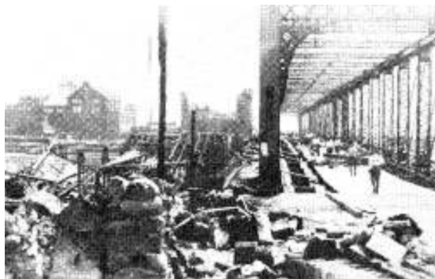
焼け落ちた吾妻橋

では、まず「前史」から紹介しよう。記載されている時代は昭和32年発行の区史とほぼ同時期だが、大きな相違点は、前回の区史が行政分野別に整理されているのに対し、「前史」は時代の流れに沿って記述されていることである。特に明治以降に焦点が当てられており、中でも第七章 関東大震災と帝都復興の項では、震災の被害状況やその後の復興計画が詳細に記されている。死者数や罹災戸数はもちろん、ライフラインといわれている電気、ガス、水道の被害規模や公共施設の倒壊状況、更には道路・公園等の樹木被害まで、それぞれの被害数が一の位まで記載されている。