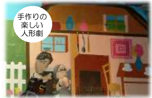
手作りの楽しい人形劇