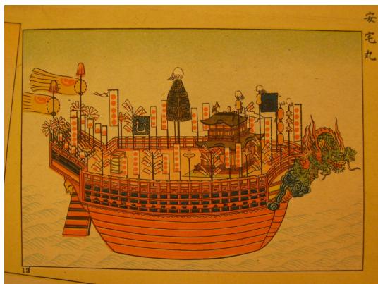
あたけまる 安宅丸

安宅丸は、寛永8年（1631）に徳川秀忠が船手頭の向井将監（むかいしょうげん）に命じて、伊豆の伊東で造らせたもので、寛永11年に完成した。大艦（おおろ）100挺立ての大船で長さ47.4m、幅16.2m、排水量は1,700トンあったといわれる。金の鯨をのせた二層の天守がそびえ装飾は、日光東照宮と並び称されるほど豪華なものだった。完成の翌年、江戸に入船するときには歌舞伎役者の中村勘三郎が、竜頭を飾った舳先に立って艦拍子音頭（ろびょうしおんど）の主演を演じている。安宅丸の航海は伊豆から江戸までの一回のみで、堂々たる姿を将軍以下諸大名に見せつけた後は入堀に係留されたまま部（しとみ）でかこわれ二度と動くことはなかった。