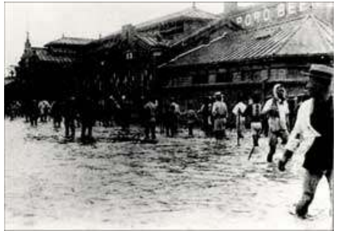
明治43年 冠水した吾妻橋付近

「カミソリ堤防」という言葉をご存知でしょうか。昭和32年から昭和50年までにかけて作られた直立堤防のことです。その姿はまさに「カミソリ」で隅田川と人々を断ち切るように建っていました。これは、戦後すぐ襲ってきた「キャスリン台風」や「キティ台風」、昭和33年の「狩野川台風」等によって大きな被害を受けたことから、高潮や洪水から街を守るため作られたものです。