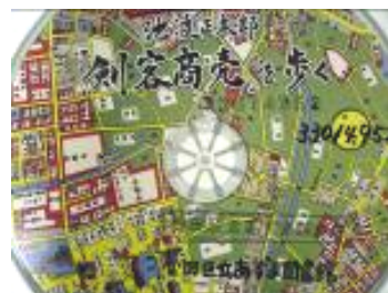
CDのように取るタイプ