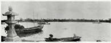
古代からの交通の要地であった隅田の渡し

江戸より以前の中世の頃、利根川は、葛飾亀有の辺りで西へ蛇行し、小菅、牛田を通して隅田に至り海に注いでいた。その亀有から隅田までの流れを、荒川から続く隅田川に対して古隅田川と称した。現在の葛飾区と足立区の区境になっているところである。利根川は、下総と武蔵の国との国境となる大河であった。その河口近くにある、隅田の渡しは、奈良時代の768年頃にまでさかのぼることができ、海と陸の接点にあるこの地は、政治・軍事上の要でもあったといわれる。