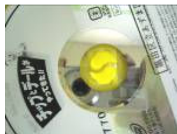
真ん中を押すタイプ