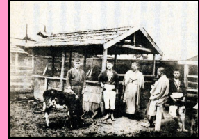
左千夫の本所茅場町牧場

今年1月号の「すみだの歴史」の中で、丑年に関連して伊藤左千夫についてふれてしたが、今回は彼についてもう少し詳しく書いてみたいと思う。